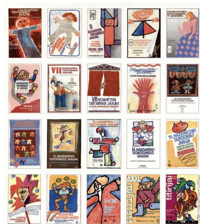
20 años contigo - 20 urte zurekin - 20 years with you

Con motivo de la celebración del 40 aniversario del Titirijai, proponemos una exposición de cartelería que recogerá los carteles de diferentes ediciones del festival de marionetas. Cada ejemplar tiene un diseño único creado para la ocasión, la abundancia de formas y colores son característicos de estos ejemplares que repasan la trayectoria que ha tenido esta festividad que traspasa fronteras.